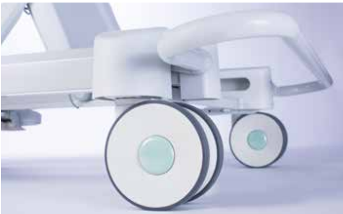
Ruedas opcionales de doble banda de 125 mm **