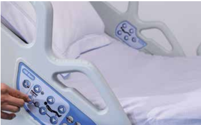
Asas antideslizantes y mandos integrados