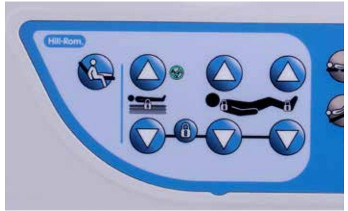
Indicador de altura baja y función de salida lateral con una sola pulsación