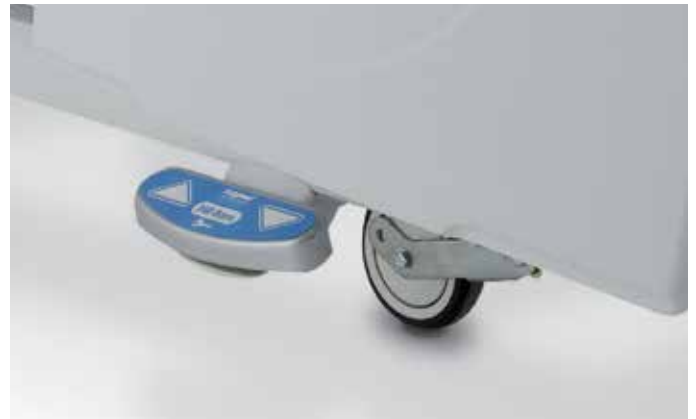
Pedal opcional bilateral de control de altura con bloqueo automático y quinta rueda direccional