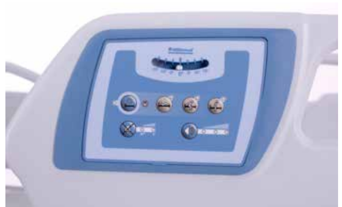
Alarma de salida de cama de tres modos